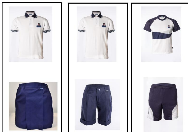
Sept – Half Term / Easter - June

Niños y niñas: Camiseta de manga corta blanca y azul marino, pantalón corto azul marino, calcetines azul marino blancos y zapatillas blancas, azul marino o negras.