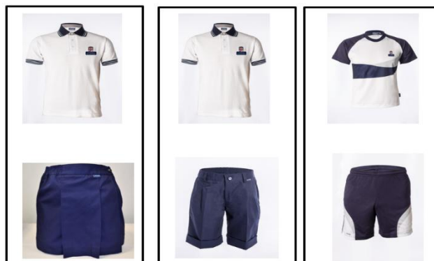
Sept – Half Term / Easter - June

Niñas: Polo blanco, falda-pantalón azul marino, calcetines azul marino, zapatos escolares azul marino o negros.