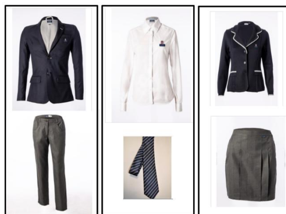
Nov - Easter

Niños y Niñas: Camiseta blanca de manga corta, chándal escolar, zapatillas blancas, azul marino o negras y calcetines azul marino o blancos.