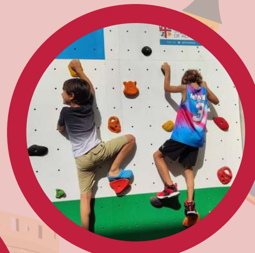
Games and Sports Juegos y Deportes