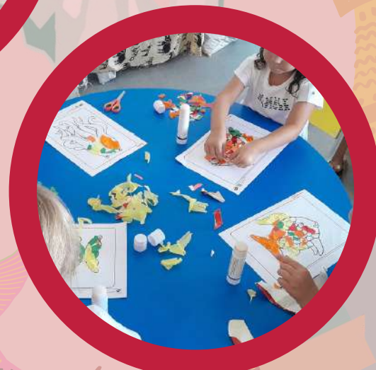
Arts and Creativity Arte y Creatividad