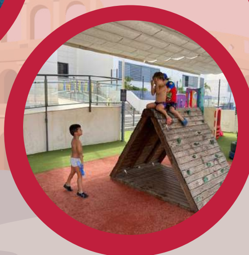
Great Outdoor Spaces Grandes Espacios al Aire Libre