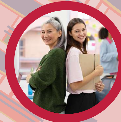
Native teachers profesores nativos