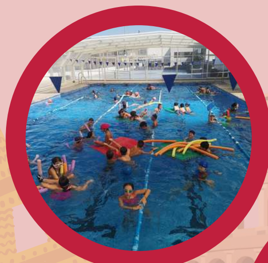
And lots of fun!! Y mucha diversión