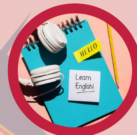
English immersion Inmersión en inglés