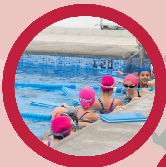
Swimming Pool Piscina